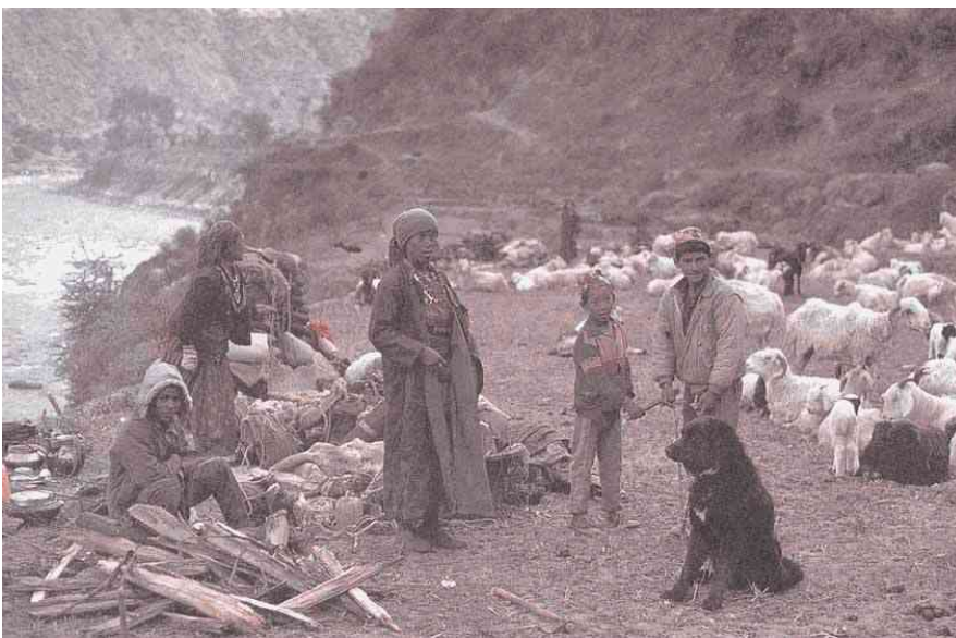
Nomaden, Nepal mit Do Khyi

Viele wertvolle Blutlinien der Rasse sind durch die Verfolgung dieser Hunde durch die Chinesen in Tibet ausgestorben und unwiederbringlich verloren. Nachdem der Do Khyi eine Grundlage der bäuerlichen, nomadischen Lebensform der Tibeter darstellt sind besonders diese Hunde verfolgt und umgebracht worden um den Boden für eine neue, den chinesischen Vorstellungen angepasste Lebensweise zu bereiten.