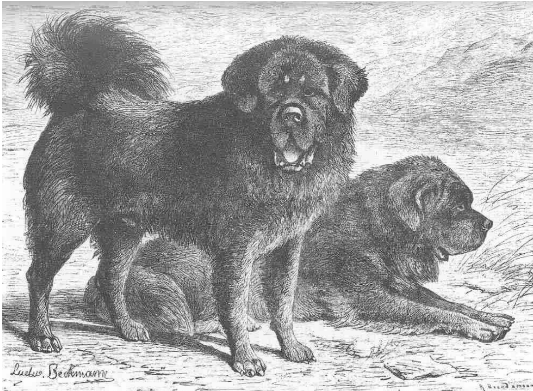
Tibethunde - Besitzer Graf Szecheni aus...Beckmann "Rassen des Hundes" Kynos Verlag

Ob der Do Khyi tatsächlich der Urvater der ebenso legendären Molosser gewesen ist, dazu gibt es viele Thesen. Die Möglichkeit bestand durch den Handelsverkehr der Antike, es ist aber auch möglich, dass gleiche menschliche Bedürfnisse und Lebensweisen die selbständige Entstehung ähnlicher Hundetypen gefördert hat. Sicherlich ist aber die Gleichartigkeit des Verhaltens vor allem mit den eurasischen Herdenschutzhunden auch heute noch festzustellen. Die Abgeschlossenheit des tibetischen Hochlandes hat uns den Do Khyi nahezu unverändert erhalten, ein Mitwirken bei der Entstehung der einen oder anderen Herdenschutzhundrasse kann durchaus möglich sein.