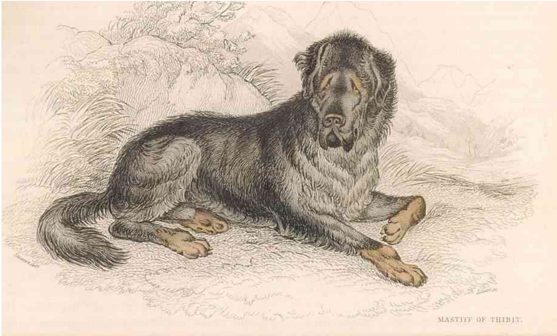
Mastiff of Tibet nach Steward aus Lizars Animated Nature, London 1832

Durch die Wirren des ersten Weltkrieges haben sich leider die Spuren dieser ersten europäischen Zuchthunde verloren, sicher auch heute noch ein nicht wieder gut zu machender Verlust für die Genetik dieser Rasse.