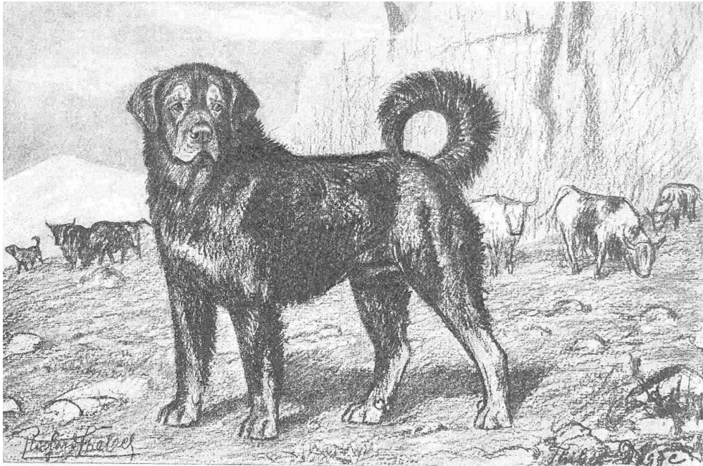
Tibetdogge Richard Strebel 1905 (Heliogravure) aus Strebel "Die deutschen Hunde"

Sicher ist der so bezeichnete Do Khyi auch um die Jahrhundertwende ein imposanter, kraftvoller Hund mit stattlichem Kopf und mastiffähnlichen Lefzen, hinsichtlich der legendären Größe ist die Enttäuschung aber bei den ersten Fachkundigen groß und bereits bei den Kynologen dieser Zeit war die vorgenommene Zuordnung zu den Mastiffs und Molossern umstritten. Durchaus erfolgte um die Jahrhundertwende 1900 bereits auch eine Zuordnung des Do Khyi zu den ebenfalls damals auch in Europa noch weit verbreiteten Herdenschutzhunden.